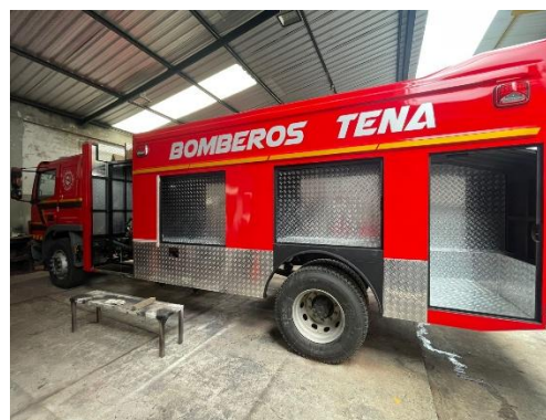
FOTO NO.6 con logos