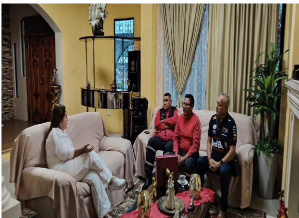
FOTO NO 11 Reunion Gerente