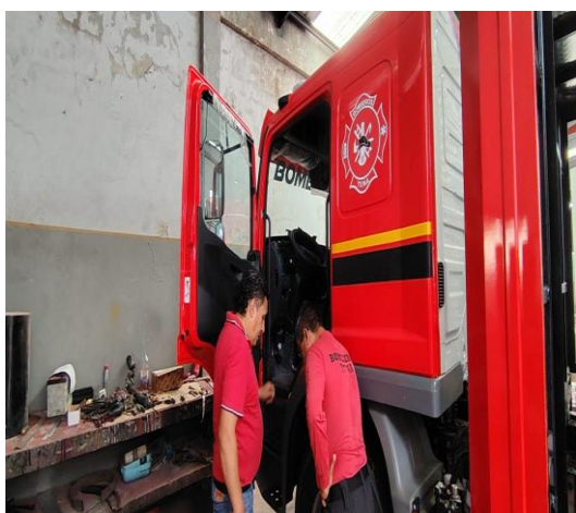
FOTO NO.7 pintada y lista