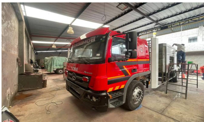
FOTO NO.5 logos Tena